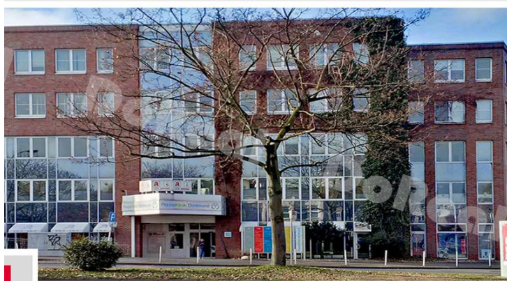
g leopoldstr. 10 - Praxisklinik Dortmund -