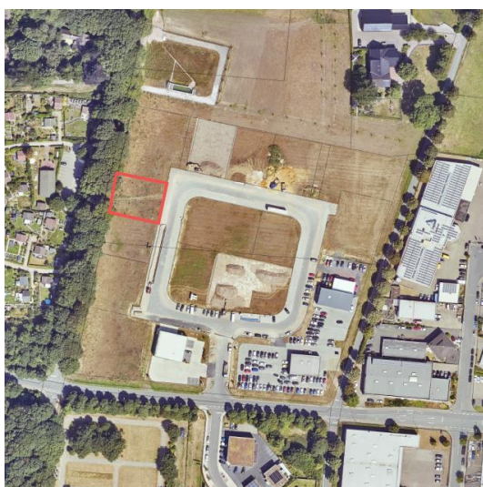
Auszug aus dem Luftbild